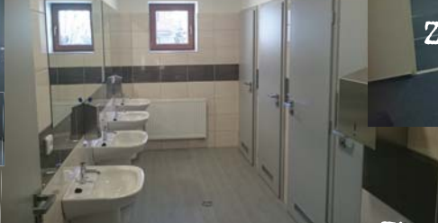
zázemí pro spolkovou činnost