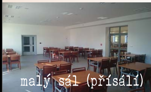
malý sál (přísálí)

Celkové náklady na realizaci Kulturního centra (včetně odkoupení původního objektu restaurace a ubytovny Krutki), jeho vybavení, opravu přílehlého objektu PZKO a vybudování zpevněných ploch představují částku 45 mil. Kč (z toho 9,1 mil. je hrazeno v rámci projektu "Synergie" spolufinancovaného z operačního programu Interreg V-A Česká republika - Polsko).