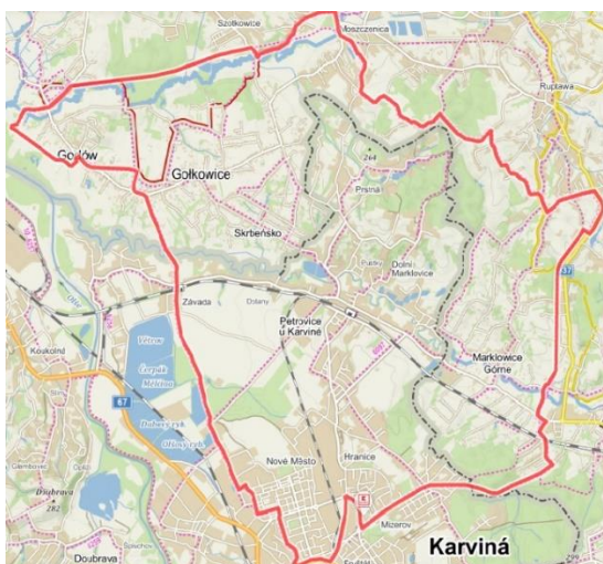
Obrázek č. 1: Cyklotrasa – Železná cyklotrasa